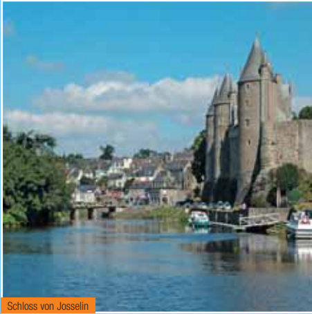
Schloss von Josselin