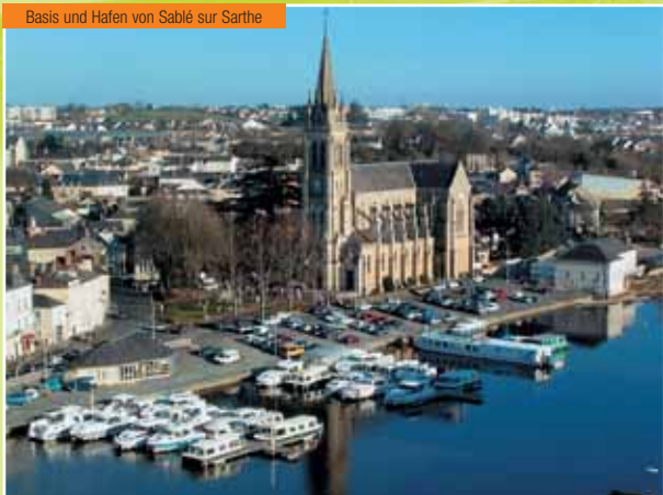
Basis und Hafen von Sablé sur Sarthe

Die Sarthe ist ein ruhiger Fluss. Auch wenig erfahrene Hausbootfahrer können sich hier gut zurechtfinden und sich über die grüne Landschaft mit ihren vielen malerischen Dörfern freuen. Besuchen Sie das elegante Schloss von Plessis Bourré, die imposante Benediktinerabtei von Solesmes, Malicorne, die Porzellan-Hauptstadt und die Altstadt von Le Mans.