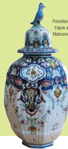
Porzellan-Fabrik in Malicorne