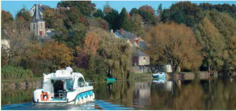
Das Tal der Mayenne: La Roussière