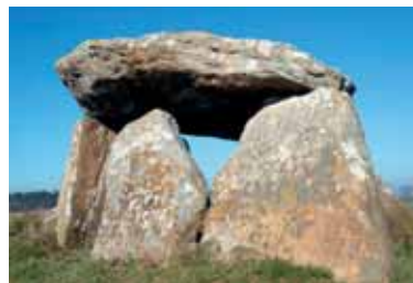
Dolmen in der Bretagne