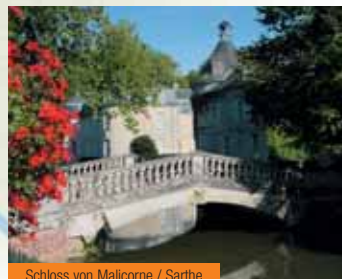
Schloss von Malicorne / Sarthe